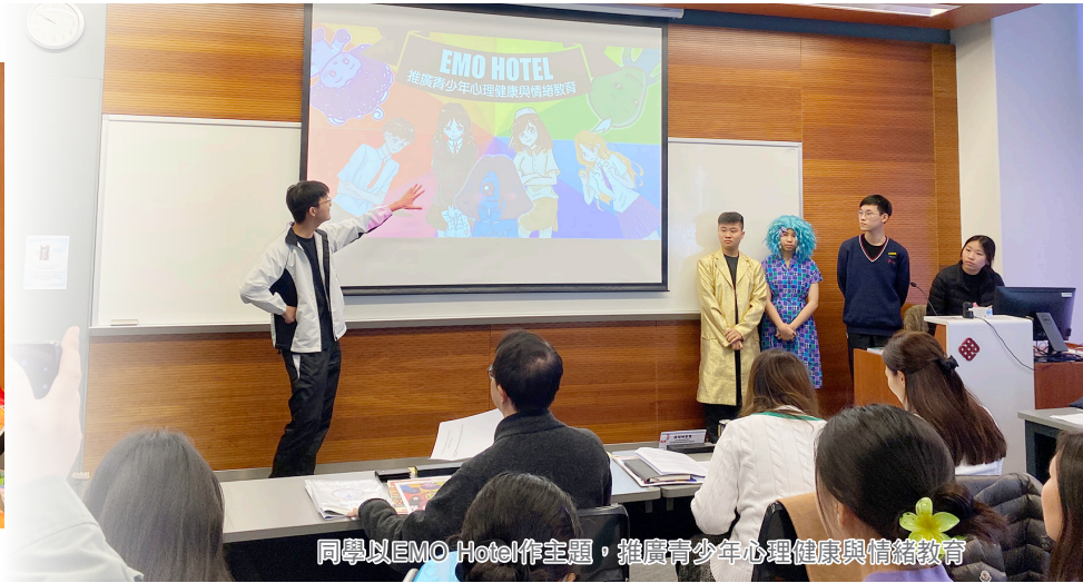
同學以EMO Hotel作主題，推廣青少年心理健康與情緒教育