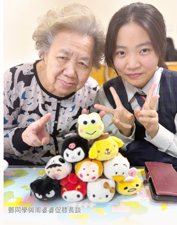
鄧同學與周婆婆促膝長談

我深信，生命故事書本身的意義在於傳承的價值，在於愛的表達。能夠讓她從傾談中回味一生，這一切都意義非凡。