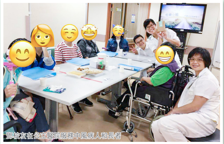
鄧校友在公立醫院服務中風病人和長者

我們有很多想做到的事可能都不是最適合我們的，我們不應強求，應先求上帝的旨意，相信神會帶領我們走最好的路。