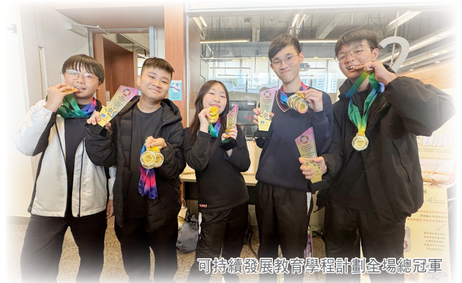
可持續發展教育學程計劃全場總冠軍

透過參與此計劃，我明白到精神疾病對於病人來說是難以控制的。精神疾病大多源於壓力，而罹患精神疾病往往在一瞬間發生。精神病人大多沒有暴力行為，我們不應刻意迴避或懼怕他們。