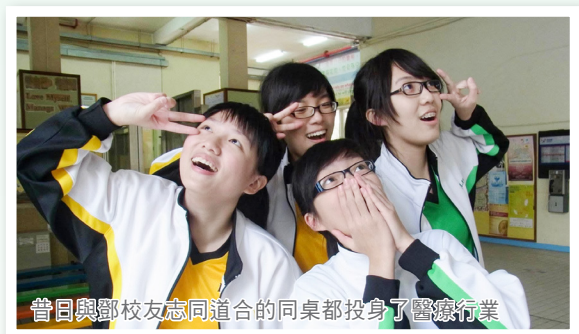
昔日與鄧校友志同道合的同學都投身了醫療行業

校友勉勵光中同學「Work hard, and play even harder」。儘管現今學生課業繁重，學業壓力大，但同學不要忘了享受校園生活，不要只讓學習佔據中學回憶，好好享受能盡情地「做自己」的時光。在讀書方面，她認為最重要是找到適合自己的溫習方法，而且要專心溫習，因為只有理想的成績，才能有更多的選擇。在信仰方面，她鼓勵未信的同学要繼續認識神，而作為基督徒的同學則要堅守自己的信仰，因為有不少信徒會因工作繁忙或人生階段轉變而離開信仰。最後，她鼓勵同學們迷茫時禱告，尋求神的指引，相信神會帶領我們走最好的路。