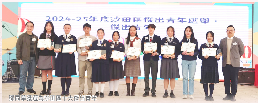
鄧同學獲選為沙田區十大傑出青年