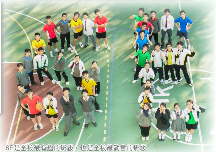
6E是全校最有趣的班級，也是全校最勤奮的班級