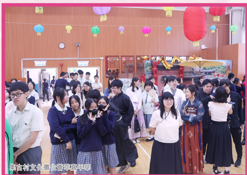
集古村文化攤位齊聲嘉年華

四社的攤位遊戲吸引了許多同學參與，例如恩社藉著配對民族服飾進行遊戲，加強同學們對民族服飾的認識。其他社亦透過一些有趣的小遊戲來向同學介紹中國古代的食物、住宿和交通工具。這次活動不但能讓同學暫時放下所有學業上的壓力，愉快地贏取禮物，還能讓同學們更深入了解到中國的歷史和文化。透過這些輕鬆的小遊戲，讓同學們在歡聲笑語間，領會到中華文化的偉大，增加了他們的歸屬感。