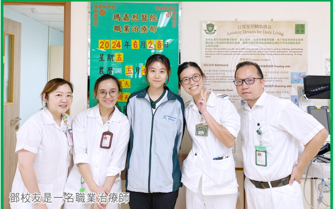
鄧校友是一名職業治療師