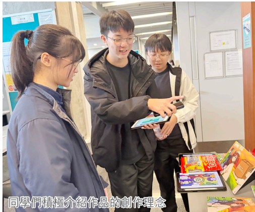
同學們積極介紹作品的創作理念

在參與可持續發展教育學程的過程中，我對大眾普遍存在的情緒病有了全新的認識。其中最讓我印象深刻的是強迫症——患者並非只是完美主義者，而是當焦慮發作時，他們會被迫通過重複行為來緩解不安。這些在外人看來毫無意義的強迫行為，對他們而言卻是重要的情緒調節方式。課程中最具挑戰的是創作教育劇場劇本，我們要將複雜的心理狀態轉化為戲劇語言，同時兼顧教育意義，過程充滿困難。幸好有導師的指導和同學的幫助下，我們最終完成了這部凝聚心血的劇作。這段經歷不僅提升了我的創作能力，更培養了我對情緒病患者的同理心。看著作品從雛形到最終呈現，我內心充滿感激。希望這個劇本能幫助觀眾打破刻板印象，讓大家對情緒病有更全面、更人性化的認知。這趟學習之旅讓我獲益良多。