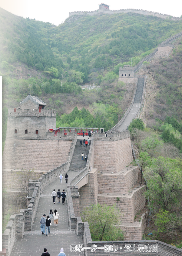
同學一步一腳印，登上居庸關