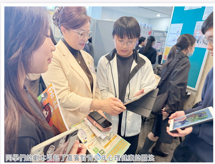
同學們的劇本引起了嘉賓對青少年心理健康的關注