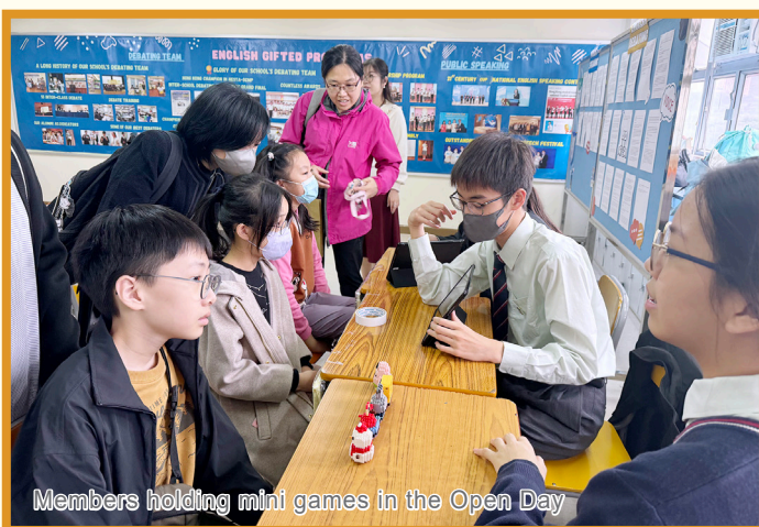
Members holding mini games in the Open Day