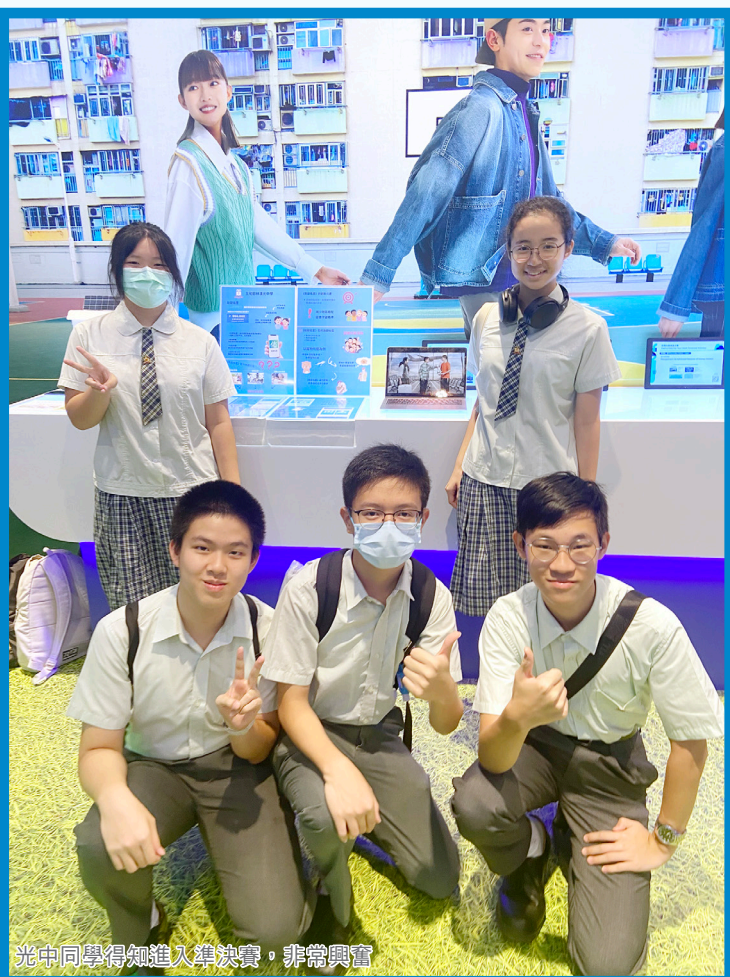
光中同學得知進入準決賽，非常興奮