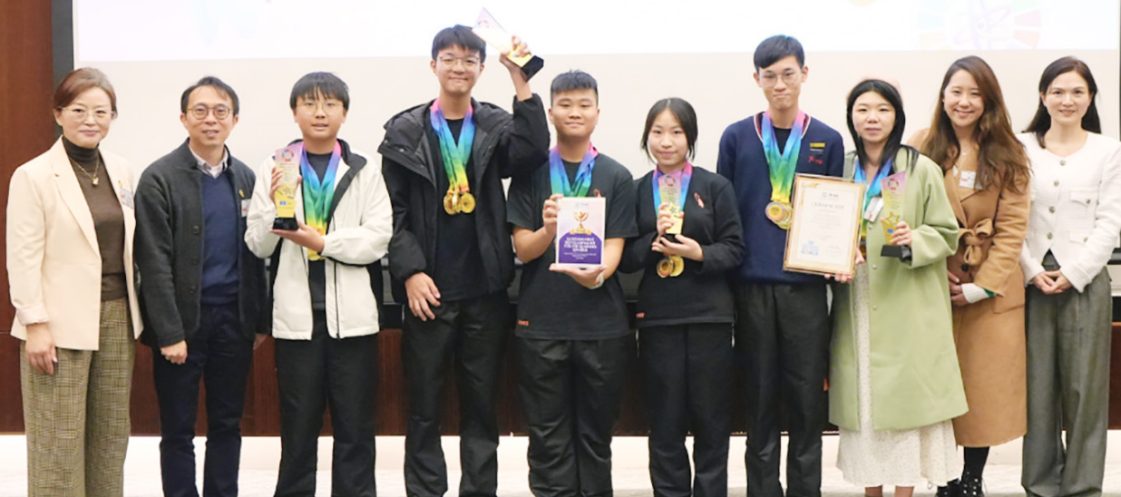
中學組一等獎：可持續發展研學青年領袖獎 五旬節林漢光中學 – 「EMO 酒店-推廣青少年心理健康與情緒教育」