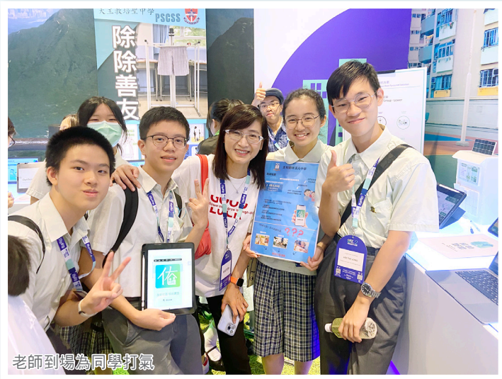
老師到場為同學打氣