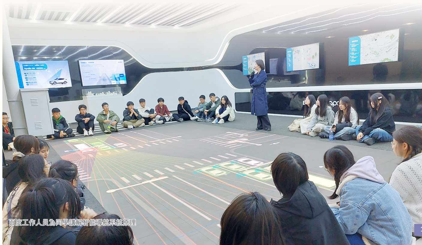
百度工作人員為同學講解智能導航系統原理