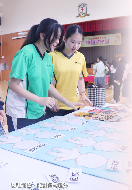
恩社攤位：配對傳統服飾

此次活動讓同學獲益良多，各攤位讓人親身感受到中國傳統文化的偉大，古代科技雖不發達，但靠雙手製作出各種玩意。一雙巧手，既能做出美觀可口的糖畫，又能以皮革和毛髮製成消閒的球，還能借一桶水與少許漆染出繽紛花紋。古人的智慧令人嘆服。中華文化中有如此寶貴的传统特色，是其他國家沒有的。我們要將中國傳統文化傳揚開去，讓更多人明白中華文化的偉大。