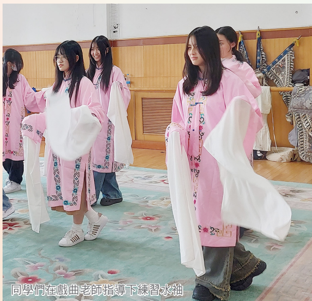
同學們在戲曲老師指導下練習水袖