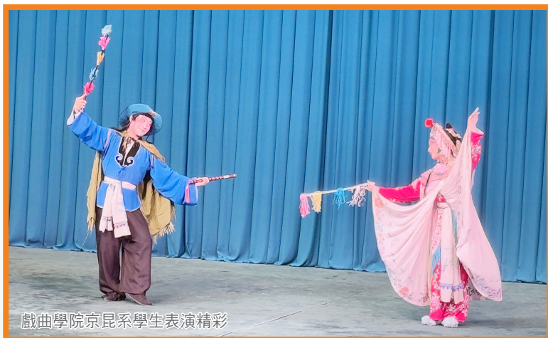
戲曲學院京昆系學生表演精彩

此行讓我深刻體會京劇演員的不易，也感受到他們推廣非遺文化的熱情。可惜京劇節奏較慢，年輕人難以靜下心來欣賞。但幸運的是，近年京劇與潮流相結合，讓更多年輕人接觸這門藝術。希望未來我能為傳承中國文化盡一份力。