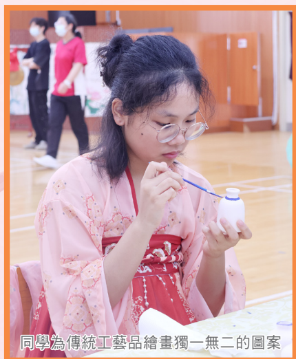
同學為傳統工藝品繪畫獨一無二的圖案

一雙巧手，既能做出美觀可口的糖畫，又能以皮革和毛髮製成消閒的球，還能借一桶水與少許漆染出繽紛花紋。古人的智慧令人嘆服。