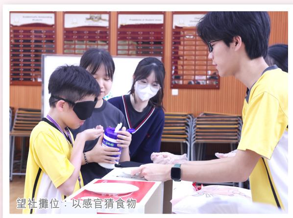
望社攤位：以感官猜食物

今年學術周（2025年5月）以「玩味中華」作主題，由中文、中史、普通話科老師聯合策劃，安排一連串精彩活動，以有趣的方式將中華文化介紹給同學認識，希望讓同學更認識國粹，承傳中華文化。