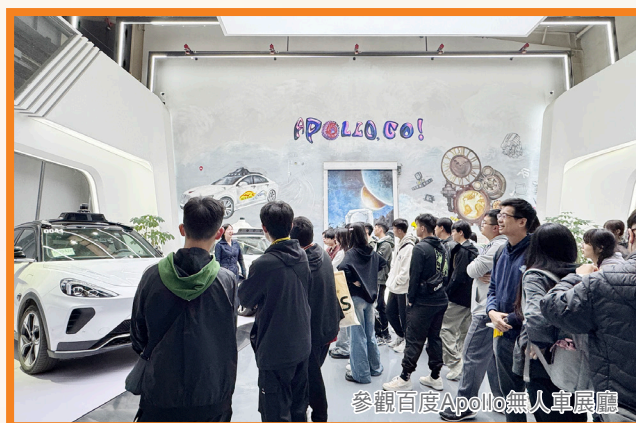
參觀百度Apollo無人車展廳

參觀未發行的汽車也讓我驚嘆，那些車輛未來感十足，融合智能導航系統，讓駕駛更人性化。我意識到，汽車已不僅是交通工具，而是生活的一部分，能更好地服務我們的日常需求。我希望有朝一日能為推動智慧城市貢獻自己的力量。