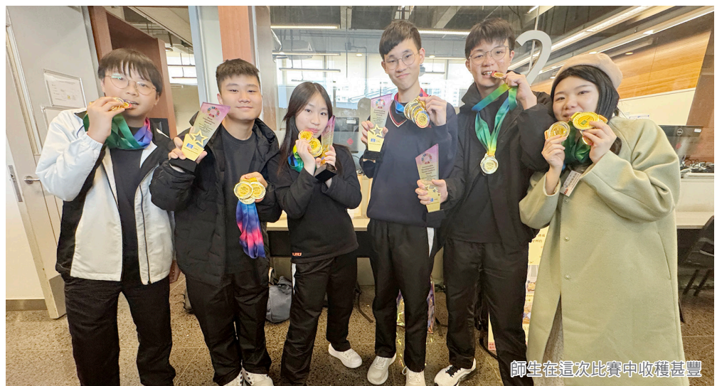
師生在這次比賽中收穫甚豐

病人並非自願患上精神疾病的，所以我們應該包容患上精神病的病人，而不是用有色眼鏡看待他們。