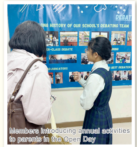
Members introducing annual activities to parents in the Open Day

Fortunately, my excitement outweighed my nervousness. I have never regretted the decision to join the English debating team. It has been a fun and educational experience so far, and I believe I made the right choice.