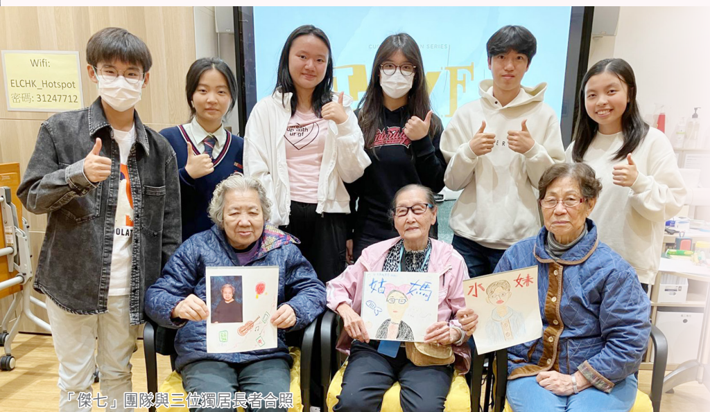
「傑七」團隊與三位獨居長者合照