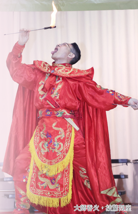
大師吞火，技驚四座

這個表演讓人感受到中國古老文化的深厚底蘊，也體會到傳統藝術在現代依然具有生命力與吸引力。變臉不僅是技藝的展現，還蘊含著豐富的象徵意義，表達角色的情緒轉變與故事的發展，並能結合現代文化。觀賞經驗讓同學對中國傳統藝術有了更深的認識與敬佩，亦激發對文化傳承的重視。