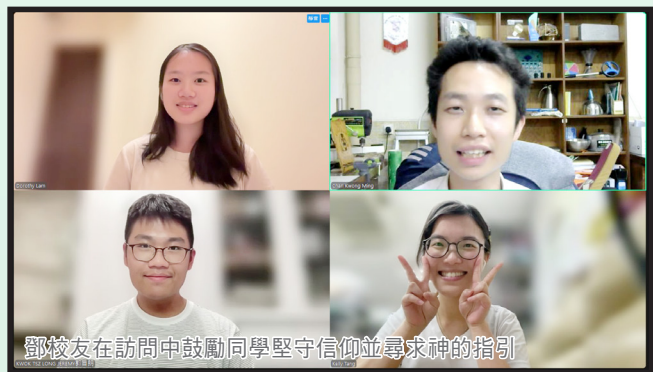
鄧校友在訪問中鼓勵同學堅守信仰並尋求神的指引

儘管她在追求信仰的路上遇到家人的反對，但她靠着經文所加給她的力量，相信經文是神對她的承諾，於是她決心去服侍神。