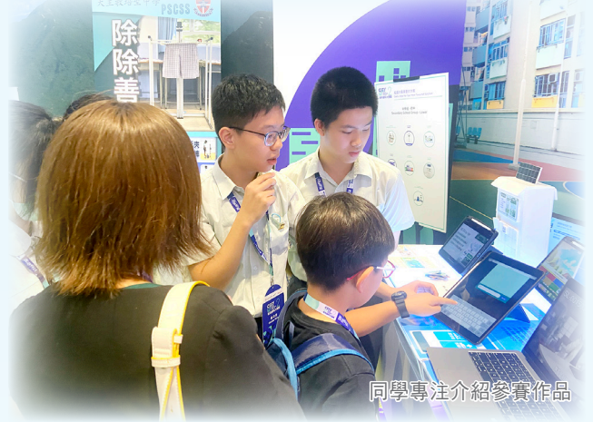
同學專注介紹參賽作品

「助鄰佑里」是一個集配對、交流功能於一體的線上平台。我們利用Uizard平台結合AI技術，耗時約9小時完成初步模型設計。過程中，我們仔細調整每個按鈕的位置和大小，確保介面一目瞭然，並透過指令優化AI產生的畫面，減少程式設計漏洞。