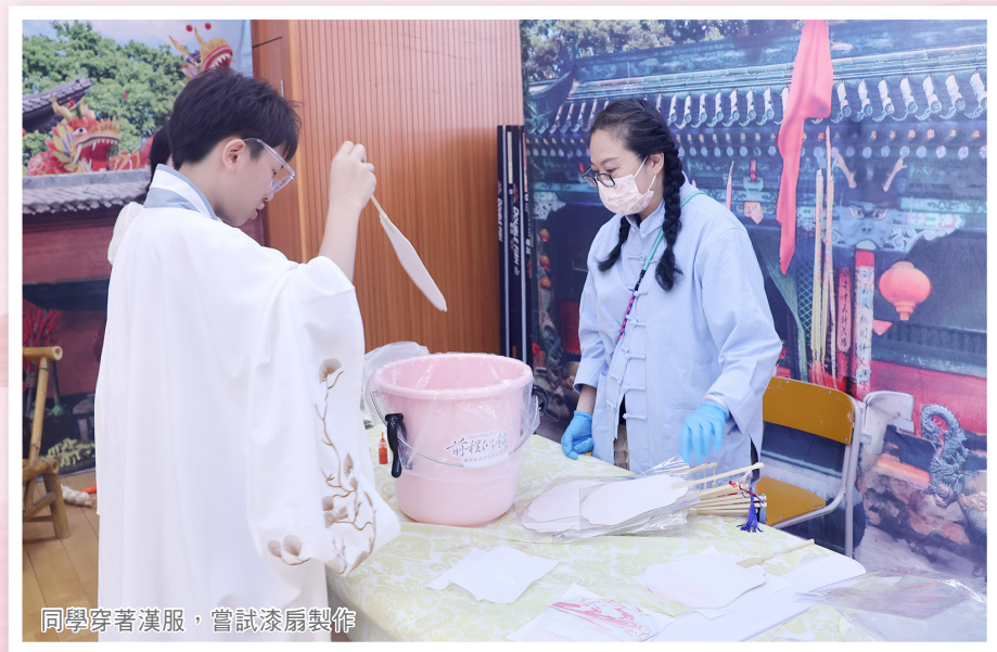
同學穿著漢服，嘗試漆扇製作