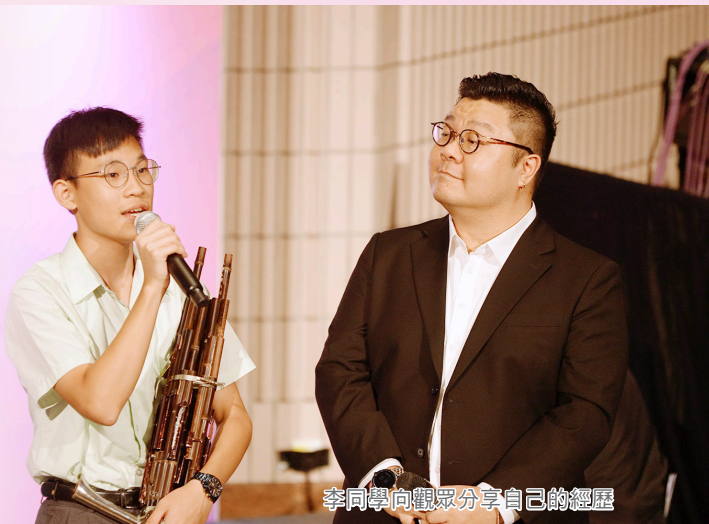
李同學向觀眾分享自己的經歷

在訪問中，我特別提到了一些我最想感謝的人，而他們就是我的父母。正因為有他們的悉心栽培和無限的支持，才能成就今天的我。他們不僅在生活上支持我，更在音樂的道路上一直鼓勵我追求夢想。而這次的演出機會肯定了我這十年來的努力。